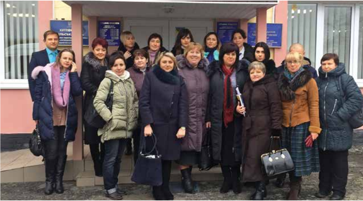
• Громада приймає гостей з інших ОТГ