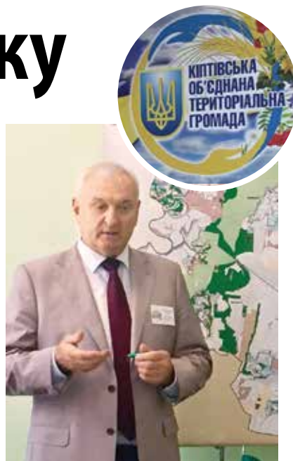
• Володимир Кучма

• Посол Канади Роман Ващук відвідав Кіпті у червні 2018 року разом з іншими послами Великої сімки