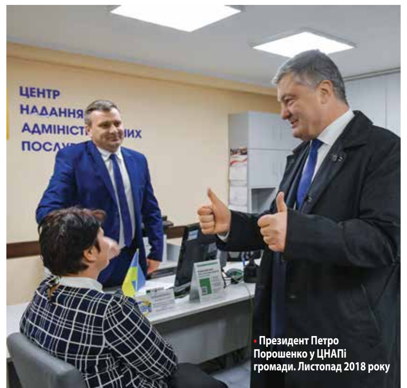
• Президент Петро Порошенко у ЦНАПі громади. Листопад 2018 року

громади закладено десятки тисяч гривень на придбання нової літератури.