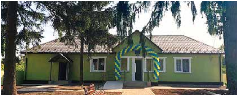
• Відремонтована амбулаторія

назви, розташований у Кіптях, у сучасній будівлі. Заходжу до кабінету голови ОТГ.