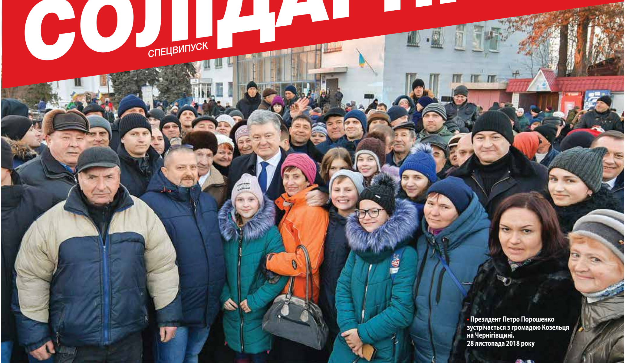
• Президент Петро Порошенко зустрічається з громадою Козельця на Чернігівщині. 28 листопада 2018 року