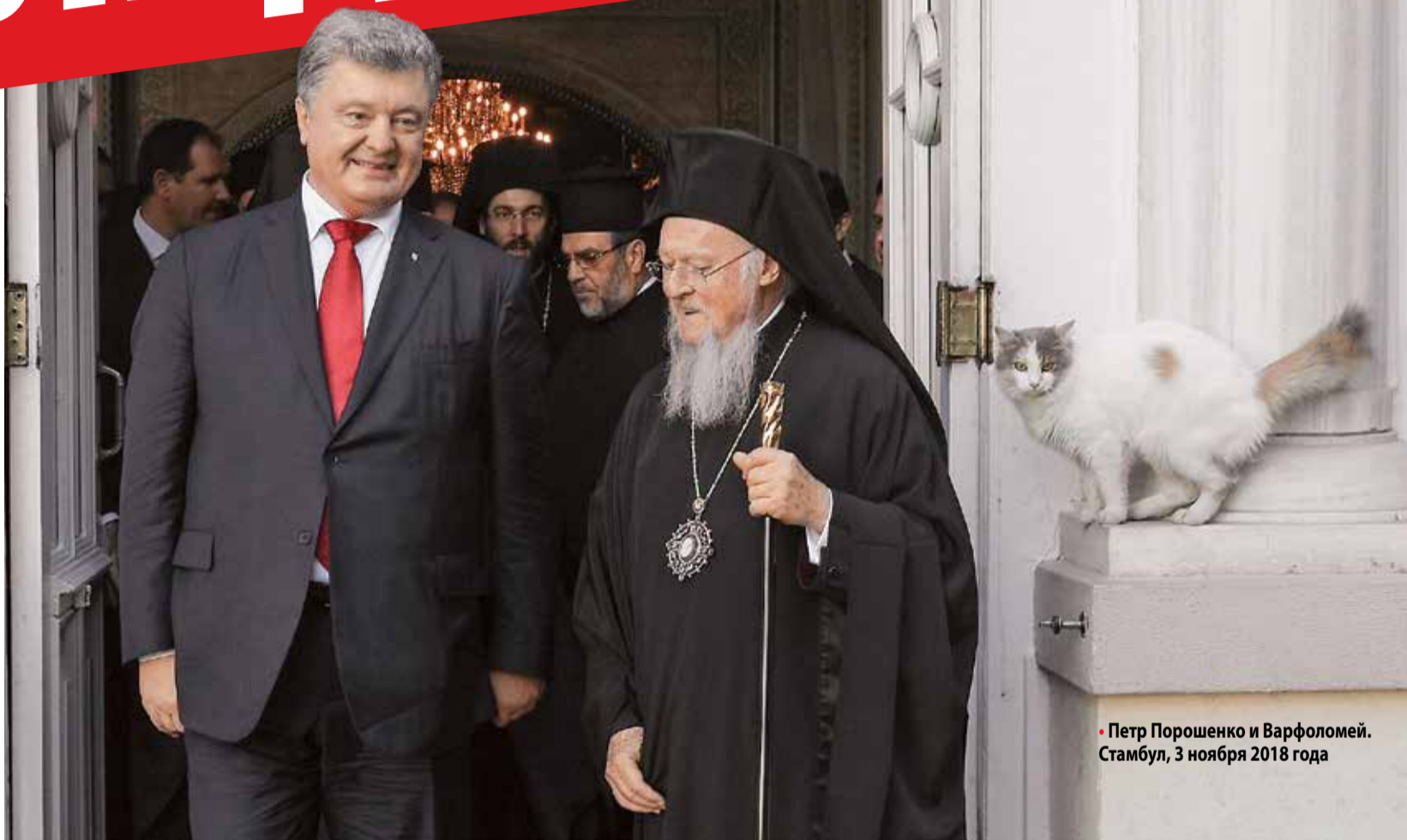
Петр Порошенко и Варфоломей. Стамбул, 3 ноября 2018 года