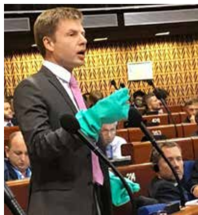
Гончаренко демонстрирует «токсичность» России в ПАСЕ

3 ноября Президент Петр Порошенко и Вселенский Патриарх Варфоломей подписали соглашение о сотрудничестве и взаимодействии в создании поместной церкви в Украине