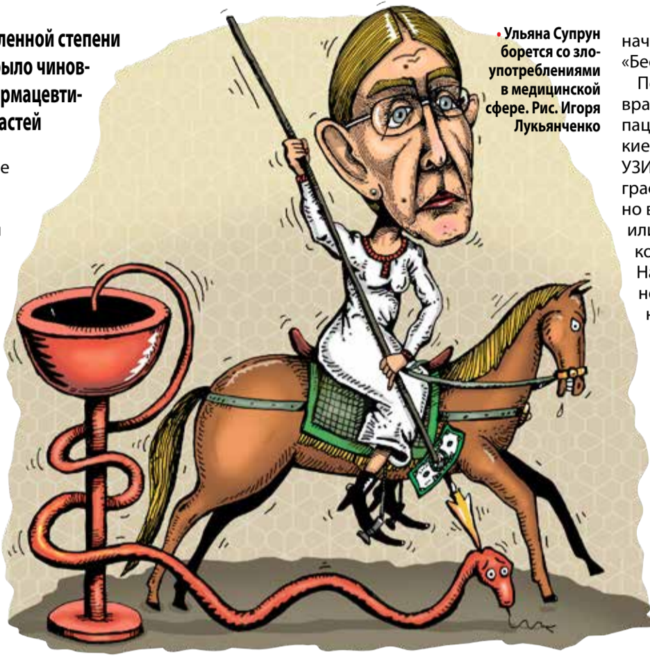
• Ульяна Супрун борется со злоупотреблениями в медицинской сфере. Рис. Игоря Лукьянченко

Только этот один факт позволяет понять ту ярость, которую испытывают дельцы и политики, которых отлучили от такого мощного коррупционного корыта.