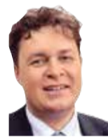
ЕВГЕНИЙ МАГДА политолог

ДЛЯ УКРАИНЫ 14 октября – День Покрова Божией Матери – традиционно является одним из главных осенних праздников, и поэтому неудивительно, что именно в середине октября мы отмечаем День Защитника Украины, введенный Президентом Порошенко в 2014 году.