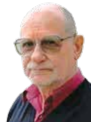
АНАТОЛИЙ СТРЕЛЯНЫЙ публицист

Главным результатом переговоров стало заявление канцлера о том, что Евросоюз продлит санкции против России. Это важное достижение украинской дипломатии на фоне стремления ряда европейских стран отменить или хотя бы ослабить санкции против страны-агрессора.