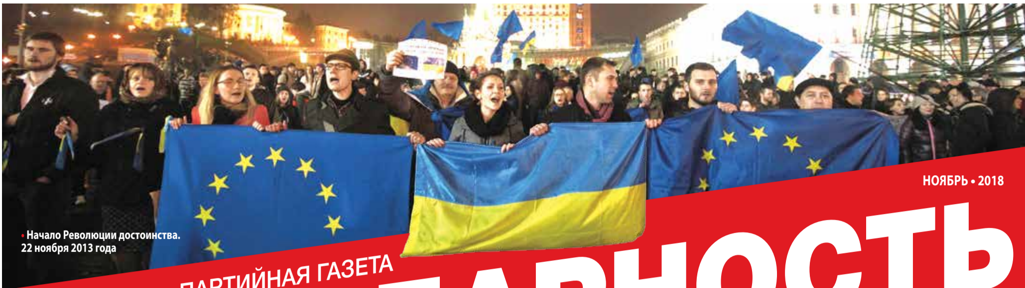
Начало Революции достоинства. 22 ноября 2013 года