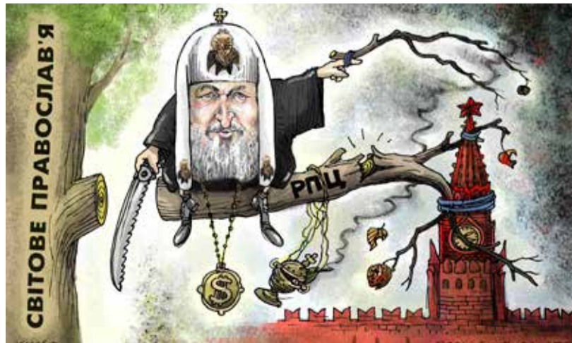
Рисунок Алексея Кустовского

С восстановлением автокефалии Киев вернет себе отобранную у него славу православной столицы Восточной Европы, «второго Иерусалима». А Москва остается наедине со своим агрессивным и исторически ничтожным мифом о «третьем Риме». Русская церковь самоизолируется вслед за российским государством. Закономерный и ожидаемый процесс.