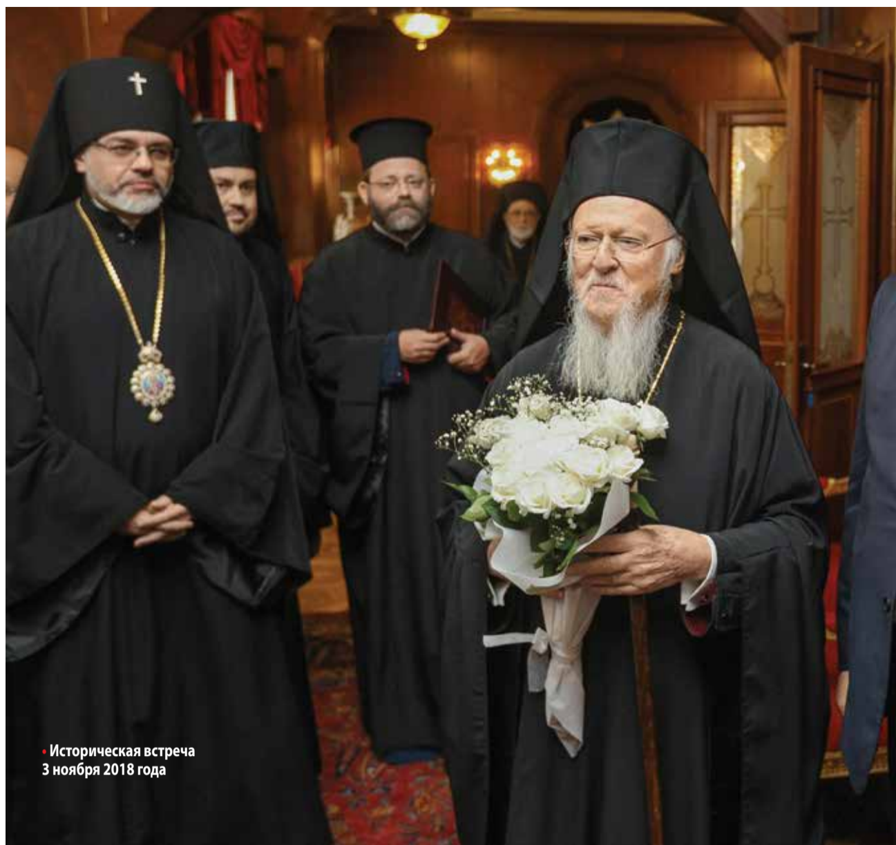
• Историческая встреча 3 ноября 2018 года

«Нравится это или нет нашим российским братьям, рано или поздно они будут следовать решениям, которые принял Вселенский Патриарх, потому что у них нет другого выбора», — сказал Варфоломей.