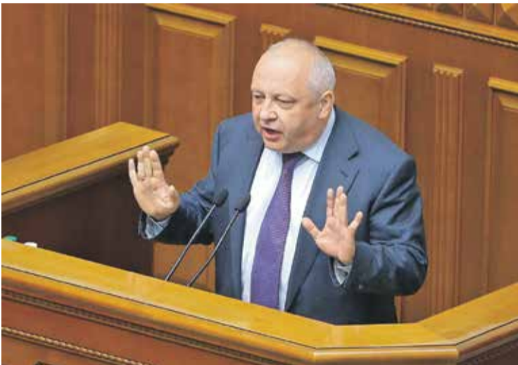
• Народний депутат Ігор Гринів під час обговорення законопроекту

За його словами, за чотири роки дуже багато зроблено для зміцнення позицій української мови. «Радіостанції зараз, і я дуже тішусь цьому, перевищують встановлені законом квоти на україномовні пісні. А що нам казали чотири роки тому? Та їх просто не існує. Ми б і раді, але без російських пісень не виживемо. Ні – усе гаразд. А чому? Рейтинги радіостанцій, які транслюють українські пісні, вищі, ніж у тих, хто транслює пісні на будь-якій іншій мові», – зауважив Петро Порошенко. Він додав, що відповідний закон почав нарешті діяти й на телебаченні, і передбачив, що результат буде такий самий.