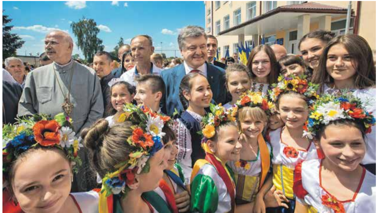
• Президент Петро Порошенко на святі останнього дзвоника в ямницькому ліцеї. Травень 2018 року

Насправді нині мусимо більше уваги приділяти саме центрові громади, оскільки в ньому ще немає єдиного адміністративного приміщення, де б можна було розмістити всі структури органів місцевого самоврядування... Маємо намір збудувати адмінкорпус, бо зараз усі служби розкидані, і це створює багато незручностей. Поки що адміністративне