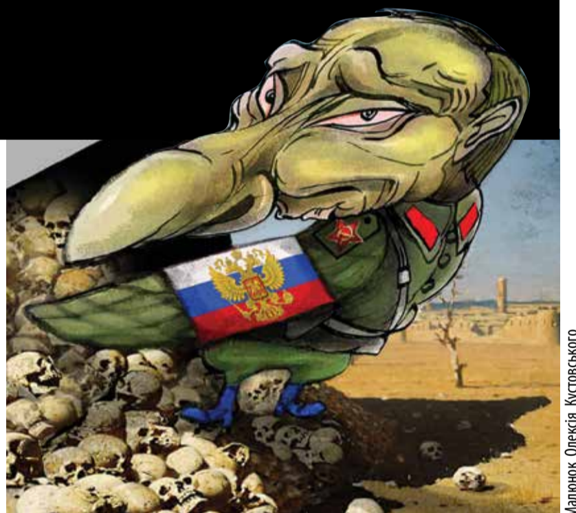
Малюнок Олексія Кустовського

Радо вітали Президента представники української діаспори в США. Звертаючись до них, Петро Порошенко зазначив: «Ми з вами повертаємо Україну в родину європейських народів. Ми з вами кажемо остаточне прощавай Радянському Союзу, російській імперії та іншим, хто намагався утримати нас у статусі колонії». Важливу роль у цьому процесі відіграє набуття українським православ'ям незалежності від Москви. «Це наше завдання – захистити Україну від тої іноземної церкви. Бо ми найбільша православна країна Європи», – зазначив він і додав: «Церква має бути одна – українська».