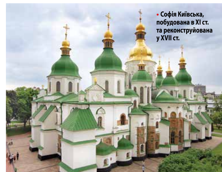
• Софія Київська, побудована в XI ст. та реконструйована у XVII ст.