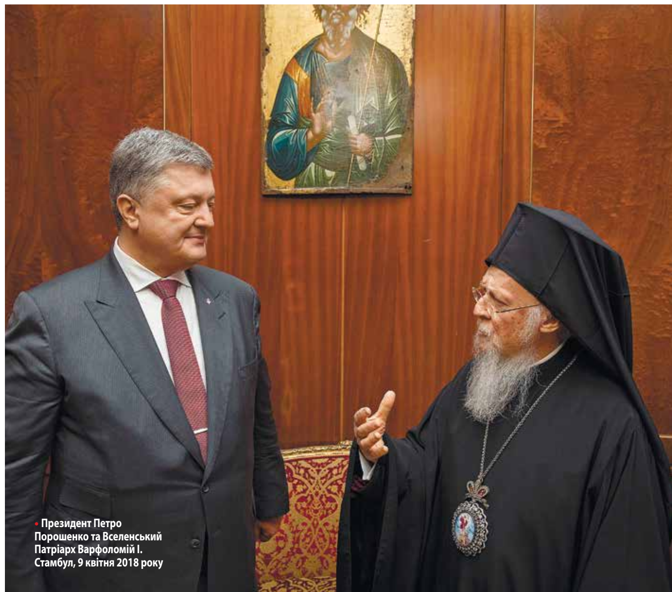
Президент Петро Порошенко та Вселенський Патріарх Варфоломій I. Стамбул, 9 квітня 2018 року