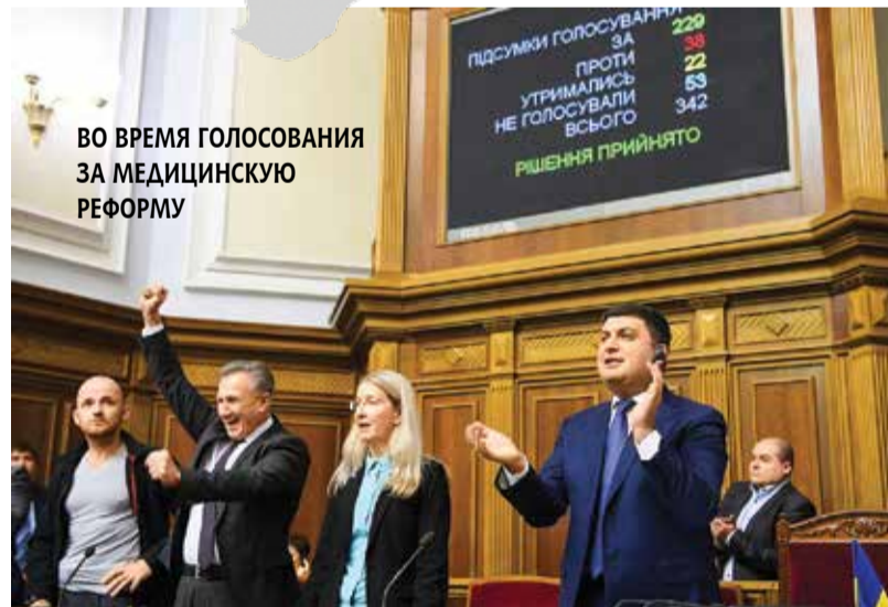
ВО ВРЕМЯ ГОЛОСОВАНИЯ ЗА МЕДИЦИНСКУЮ РЕФОРМУ