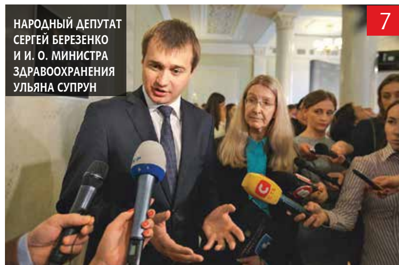
НАРОДНЫЙ ДЕПУТАТ СЕРГЕЙ БЕРЕЗЕНКО И И. О. МИНИСТРА ЗДРАВООХРАНЕНИЯ УЛЬЯНА СУПРУН