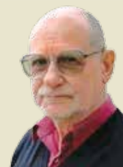
АНАТОЛИЙ СТРЕЛЯНЫЙ ПУБЛИЦИСТ

Законом признается, что Россия — агрессор. Это должно способствовать нашим дипломатам во время проведения любых дискуссий с нашими западными партнерами по реализации миротворческой миссии. Такая официальная позиция Украины поможет в изложении аргументов о нецелесообразности использования вооруженных сил Российской Федерации в качестве миротворцев.