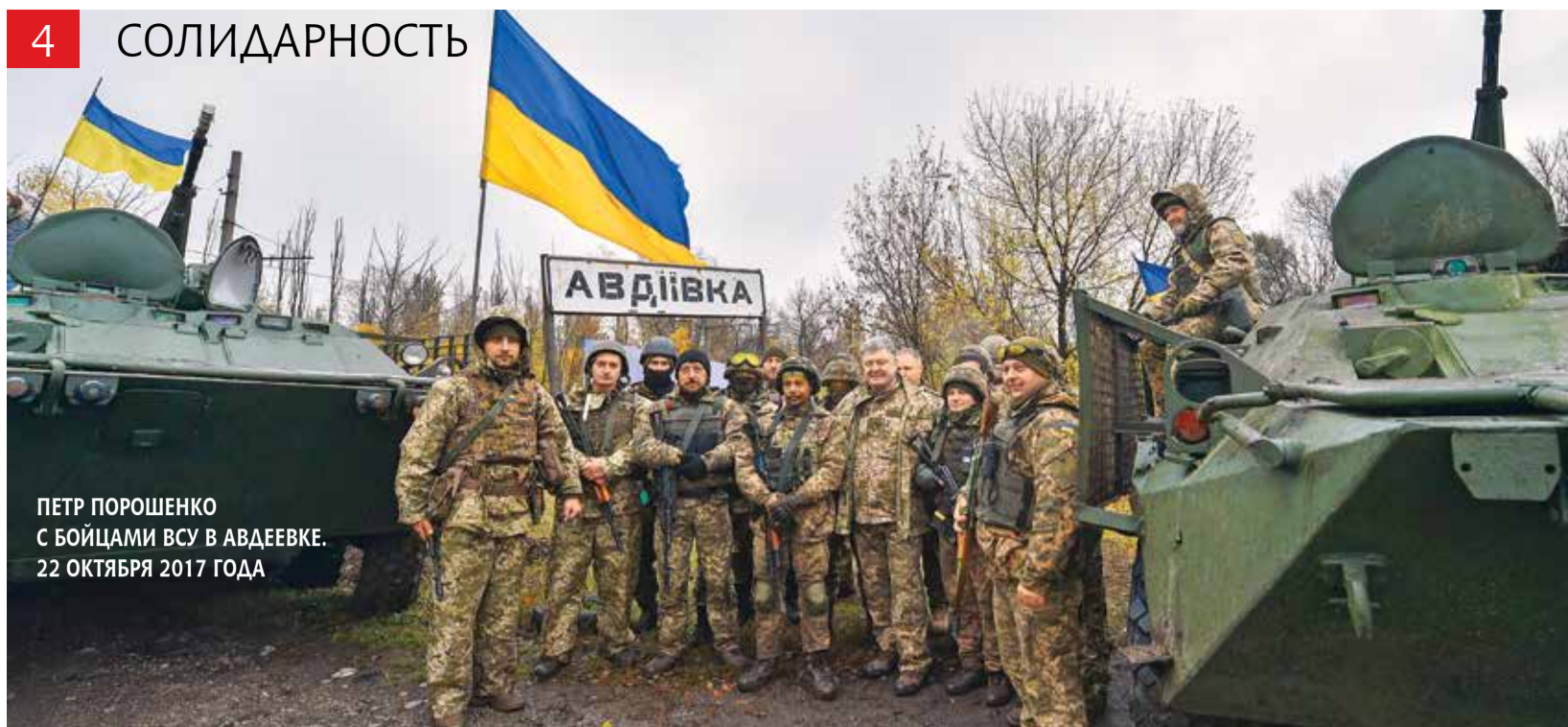
ПЕТР ПОРОШЕНКО С БОЙЦАМИ ВСУ В АВДЕЕВКЕ. 22 ОКТЯБРЯ 2017 ГОДА