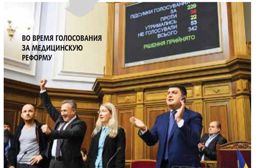
ВО ВРЕМЯ ГОЛОСОВАНИЯ ЗА МЕДИЦИНСКУЮ РЕФОРМУ