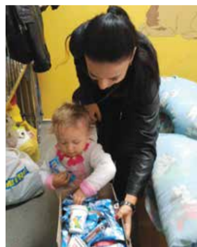
В ВИННИЦКОЙ ЦЕНТРАЛЬНОЙ РАЙОННОЙ БОЛЬНИЦЕ РАЗМЕСТИЛИ ЭВАКУИРОВАННЫХ ДЕТЕЙ