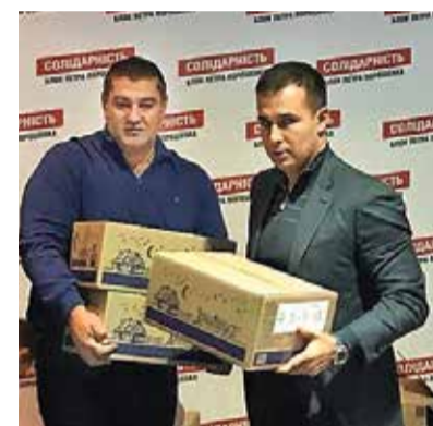
ПОСЫЛКИ ОТ ПАРТИЙНОЙ ОРГАНИЗАЦИИ ДНЕПРА