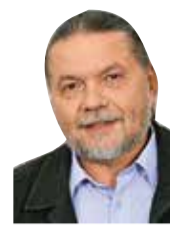
АЛЕКСАНДР БРИГИНЕЦ НАРОДНЫЙ ДЕПУТАТ УКРАИНЫ

которые были когда-то единичными символами борьбы с порабощателями, пополнились множеством блестящих операций и рейдов ВСУ, в календаре наших важных праздников теперь есть и такие, как день освобождения