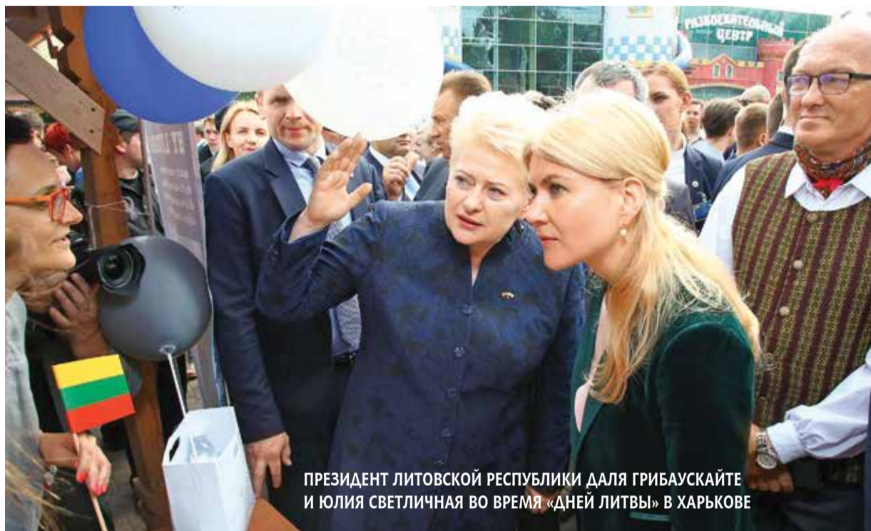
ПРЕЗИДЕНТ ЛИТОВСКОЙ РЕСПУБЛИКИ ДАЛЯ ГРИБАУСКАЙТЕ И ЮЛИЯ СВЕТЛИЧНАЯ ВО ВРЕМЯ «ДНЕЙ ЛИТВЫ» В ХАРЬКОВЕ

и самый мощный в Украине региональный центр предоставления административных услуг. Строится метро, активизировался ремонт дорог.