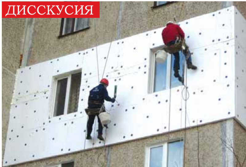
УТЕПЛЕНИЕ ФАСАДОВ ПЕНОПЛАСТОМ

ужасном состоянии. Государство, чтобы не допустить подорожания зерновых, ограничивало их экспорт и регулировало закупочные цены. Напротив, продавало аграриям по заниженным ценам горючее, удобрения, брало за границу товарные кредиты на сотни миллионов долларов в виде комбикормов и других материальных ресурсов. Однако ситуация в аграрном секторе только ухудшалась.