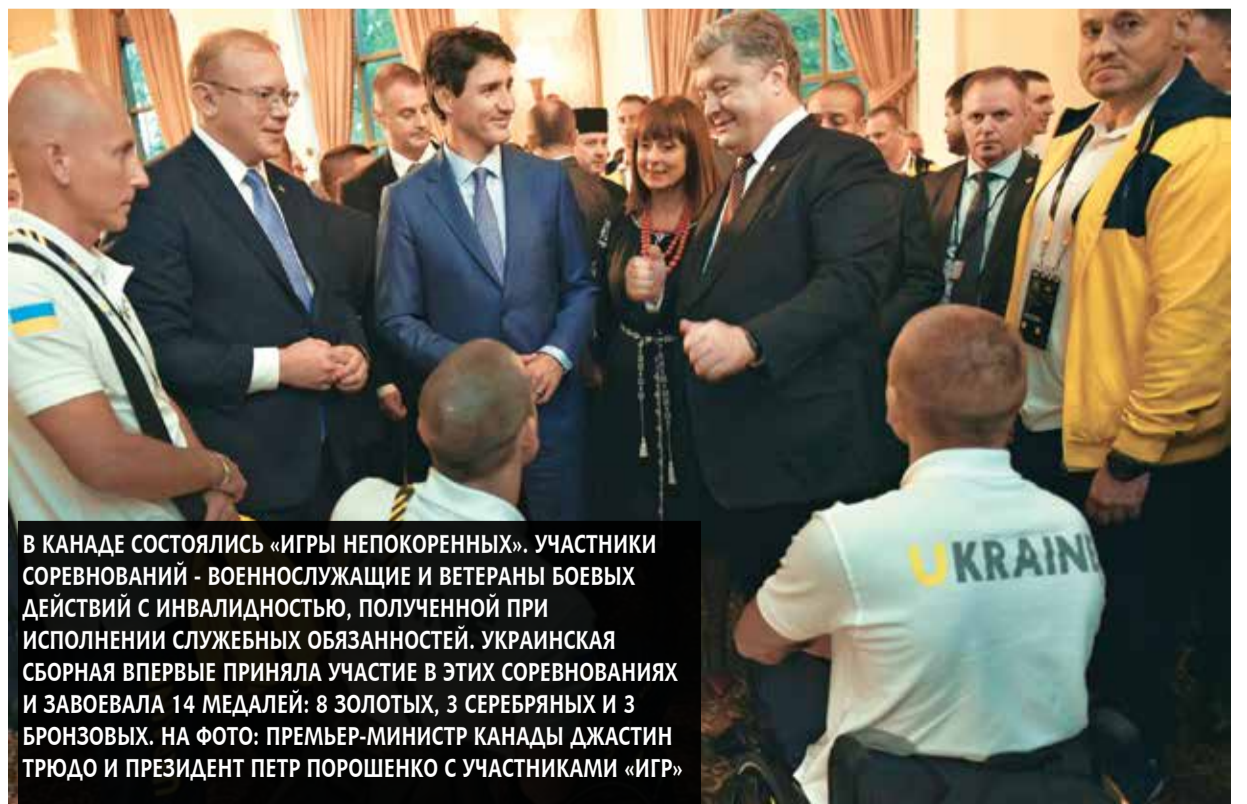
В КАНАДЕ СОСТОЯЛИСЬ «ИГРЫ НЕПОКОРЕННЫХ». УЧАСТНИКИ СОРЕВНОВАНИЙ - ВОЕННОСЛУЖАЩИЕ И ВЕТЕРАНЫ БОЕВЫХ ДЕЙСТВИЙ С ИНВАЛИДНОСТЬЮ, ПОЛУЧЕННОЙ ПРИ ИСПОЛНЕНИИ СЛУЖЕБНЫХ ОБЯЗАННОСТЕЙ. УКРАИНСКАЯ СБОРНАЯ ВПЕРВЫЕ ПРИНЯЛА УЧАСТИЕ В ЭТИХ СОРЕВНОВАНИЯХ И ЗАВОЕВАЛА 14 МЕДАЛЕЙ: 8 ЗОЛОТЫХ, 3 СЕРЕБРЯНЫХ И 3 БРОНЗОВЫХ. НА ФОТО: ПРЕМЬЕР-МИНИСТР КАНАДЫ ДЖАСТИН ТРЮДО И ПРЕЗИДЕНТ ПЕТР ПОРОШЕНКО С УЧАСТНИКАМИ «ИГР»