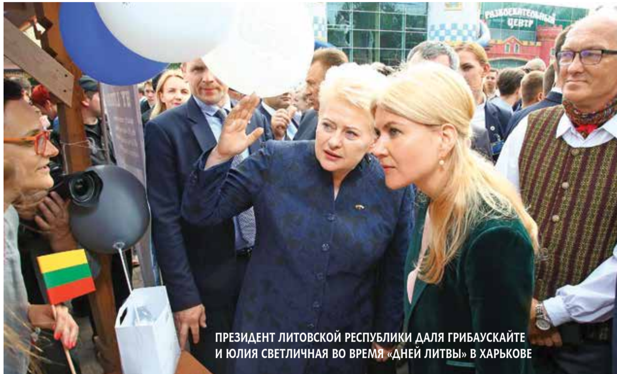
ПРЕЗИДЕНТ ЛИТОВСКОЙ РЕСПУБЛИКИ ДАЛЯ ГРИБАУСКАЙТЕ И ЮЛИЯ СВЕТИЧНАЯ ВО ВРЕМЯ «ДНЕЙ ЛИТВЫ» В ХАРЬКОВЕ

■ 29 октября во многих регионах в новосозданных объединенных территориальных громадах, в частности в Харьковской области, состоятся выборы председателей ОТГ и советов. Но по сравнению с другими областями процесс децентрализации на Харьковщине