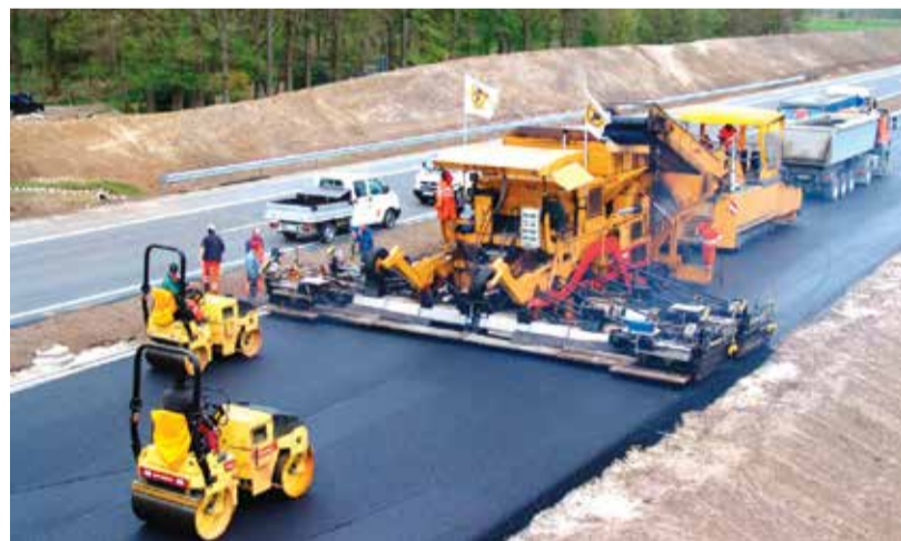
В СЛЕДУЮЩЕМ ГОДУ НА РЕМОНТ ДОРОГ ВЫДЕЛЕНО 44 МЛРД ГРН

До конца текущего года доходы местных бюджетов могут вырасти до 185 млрд грн. А на следующий год в проекте госбюджета заложено более 250 млрд гривен.