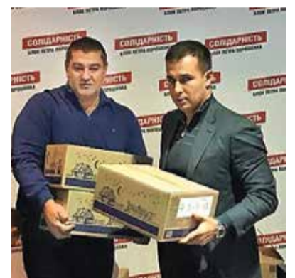
ПОСЫЛКИ ОТ ПАРТИЙНОЙ ОРГАНИЗАЦИИ ДНЕПРА

Народный депутат Украины от БПП Алексей Порошенко на своей странице в Фейсбуке выразил благодарность неравнодушным украинцам, которые пришли на