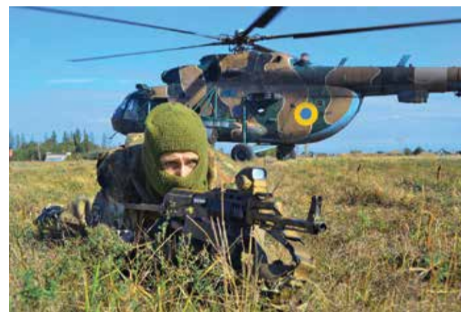
УЧЕНИЯ СПЕЦНАЗА НА ДОНЬБАСЕ

Верю, что и Донецк, Луганск, Севастополь и Симферополь тоже будут украинскими не только благодаря дипломатическим усилиям, не только из-за экономического давления на Кремль со стороны мирового сообщества, но и благодаря нашей силе и Покрове, которая хранит Украину.