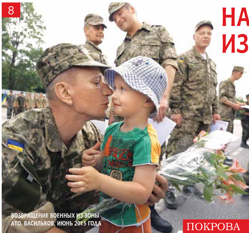
ВОЗВРАЩЕНИЕ ВОЕННЫХ ИЗ ЗОНЫ АТО. ВАСИЛЬКОВ, ИЮНЬ 2015 ГОДА