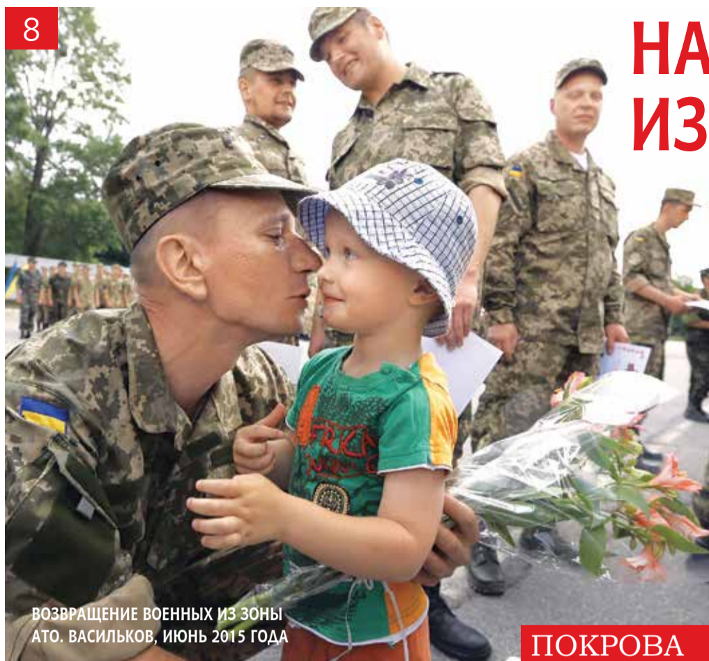
ВОЗВРАЩЕНИЕ ВОЕННЫХ ИЗ ЗОНЫ АТО. ВАСИЛЬКОВ, ИЮНЬ 2015 ГОДА