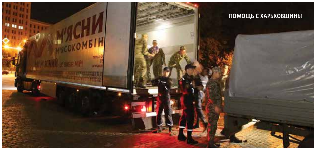
ПОМОЩЬ С ХАРЬКОВЩИНЫ