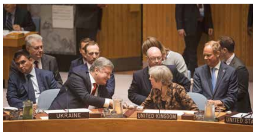
ЗАСЕДАНИЕ СОВЕТА БЕЗОПАСНОСТИ ООН. ПЕТР ПОРОШЕНКО ОБЩАЕТСЯ С ПРЕМЬЕР-МИНИСТРОМ ВЕЛИКОБРИТАНИИ ТЕРЕЗОЙ МЭЙ