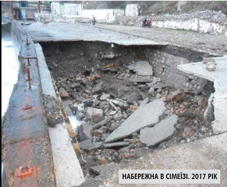
НАБЕРЕЖНА В СІМЕЇЗІ. 2017 РІК