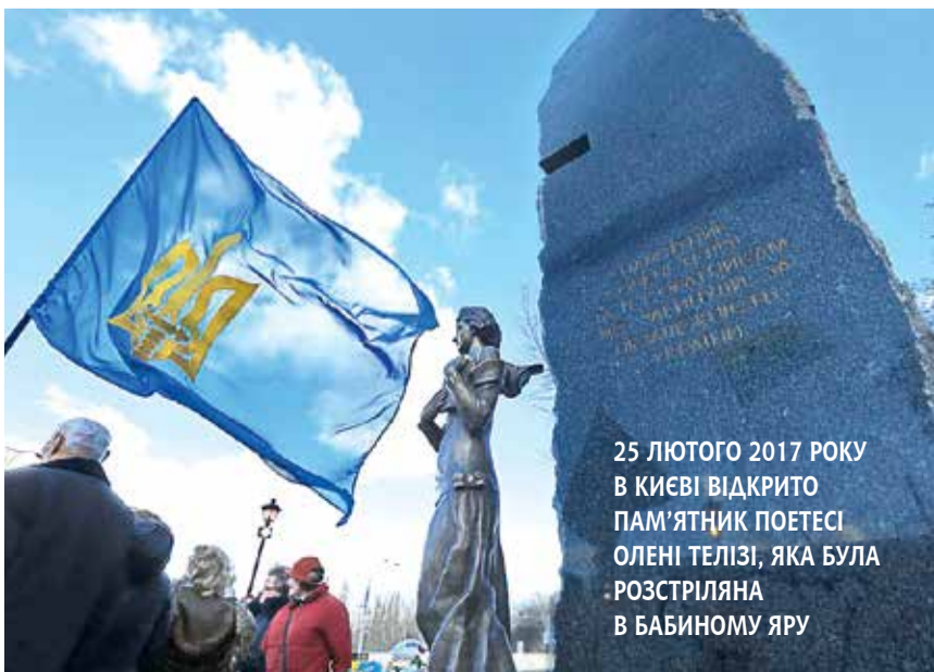
25 ЛЮТОГО 2017 РОКУ В КИЄВІ ВІДКРИТО ПАМ'ЯТНИК ПОЕТЕСІ ОЛЕНІ ТЕЛІЗІ, ЯКА БУЛА РОЗСТРІЛЯНА В БАБІНОМУ ЯРУ

Натомість істинний його сенс було втрачено. Адже боротьба жінок за свої права є ключовим складником європейських цінностей, які, однак, не мають нічого спільного зі свідомістю «радянської людини». Звільнення від якої починається з відповідальності, у тому числі й за зміст і форму тих свят, які ми відзначаємо.