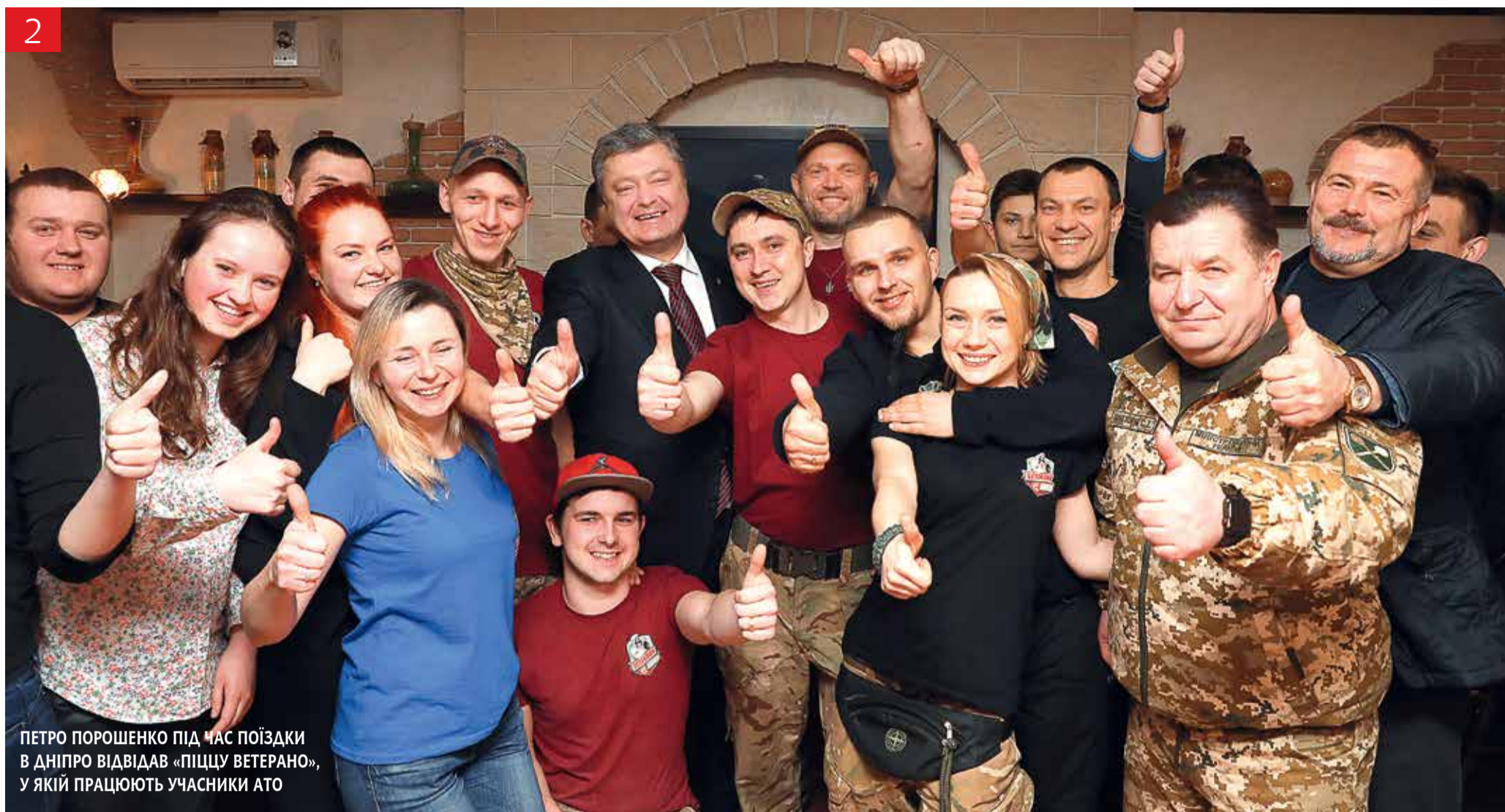
ПЕТРО ПОРОШЕНКО ПІД ЧАС ПОЇЗДКИ В ДНІПРО ВІДВІДАВ «ПІЦЦУ ВЕТЕРАНО», У ЯКІЙ ПРАЦЮЮТЬ УЧАСНИКИ АТО