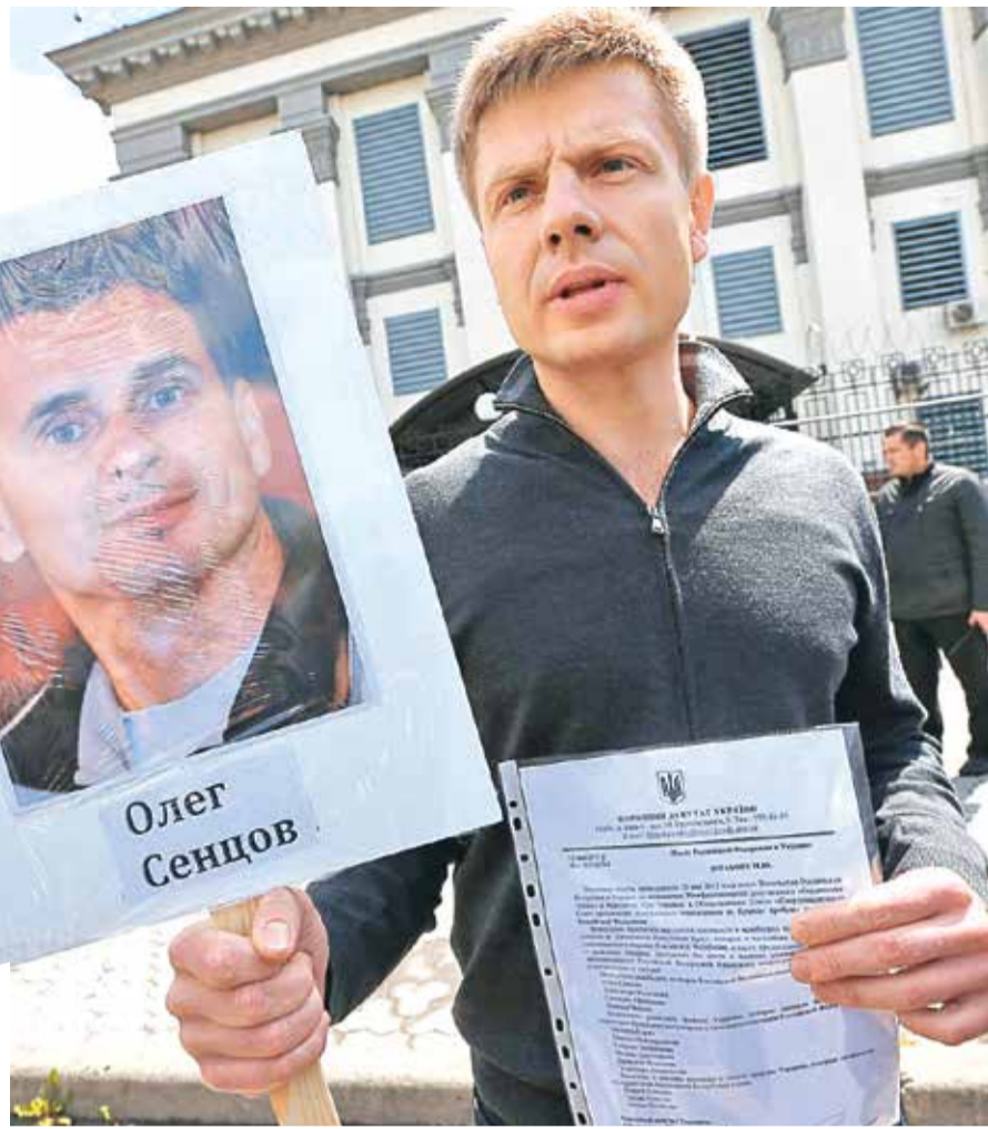
ОЛЕКСІЙ ГОНЧАРЕНКО ВИМАГАЄ ЗВІЛЬНИТИ ПОЛІТИЧНИХ В'ЯЗНІВ БІЛЯ ПОСОЛЬСТВА РФ У КИЄВІ

Росія докладает безпрецедентних зусиль, аби повернути собі повноту прав у Парламентській асамблеї Європи, але не тому, що