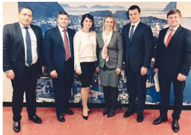
УЧАСНИКИ УКРАЇНСЬКОЇ ДЕЛЕГАЦІЇ ПІД ЧАС ВІЗИТУ В АМЕРИКУ

розслідування, Москва не припиняє гібридної війни. Основні її месиджі: заради спільних дій з ІДІЛ треба скасовувати санкції проти РФ; Україна не виконує Мінські домовленості; в Україні все погано, тож нема чого її підтримувати.