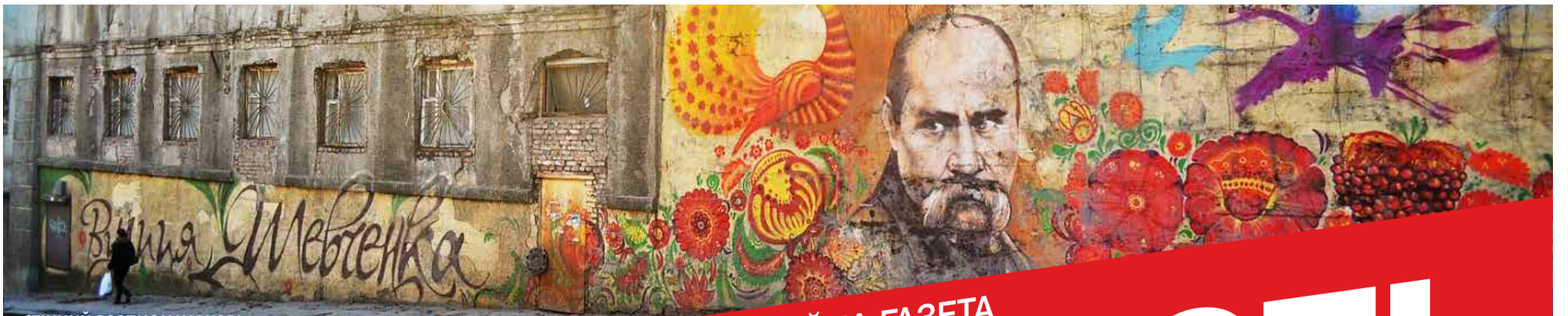
СТІННИЙ РОЗПИС У ХАРКОВІ. 9 БЕРЕЗНЯ – ДЕНЬ НАРОДЖЕННЯ ТАРАСА ШЕВЧЕНКА