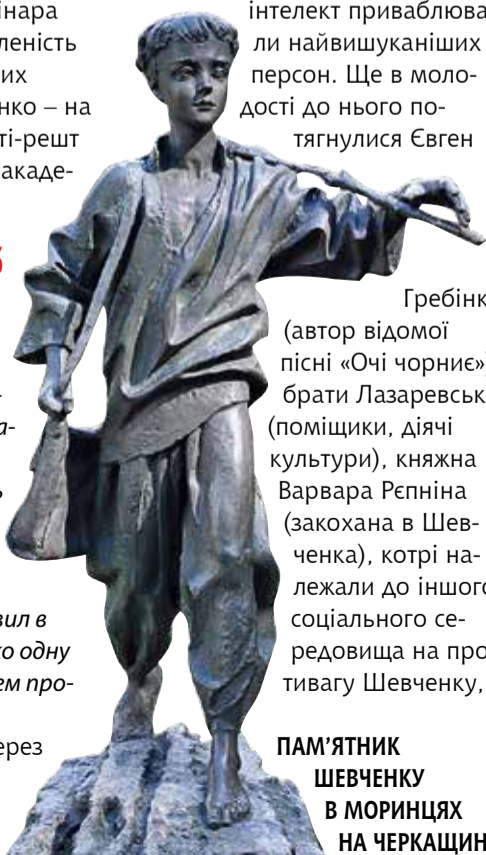
ПАМ'ЯТНИК ШЕВЧЕНКУ В МОРИНЦЯХ НА ЧЕРКАЩИНІ

Його талант, склад мислення, інтелект приваблювали найвишуканіших персон. Ще в молодості до нього потягнулися Євген