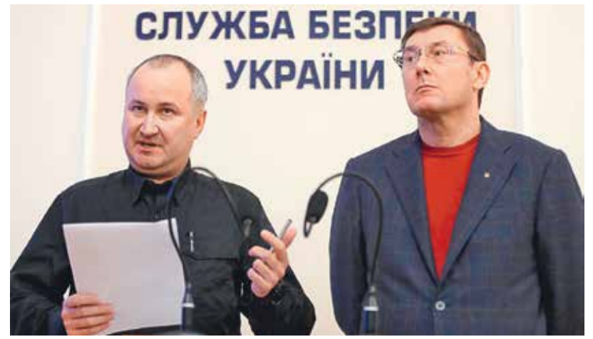
ГОЛОВА СБУ ВАСИЛЬ ГРИЦАК ТА ГЕНЕРАЛЬНИЙ ПРОКУРОР ЮРІЙ ЛУЦЕНКО

Усе це речі не нові. Але раніше Росія могла робити це майже напромаму — через різні російські фонди, а нині їй доводиться ви-