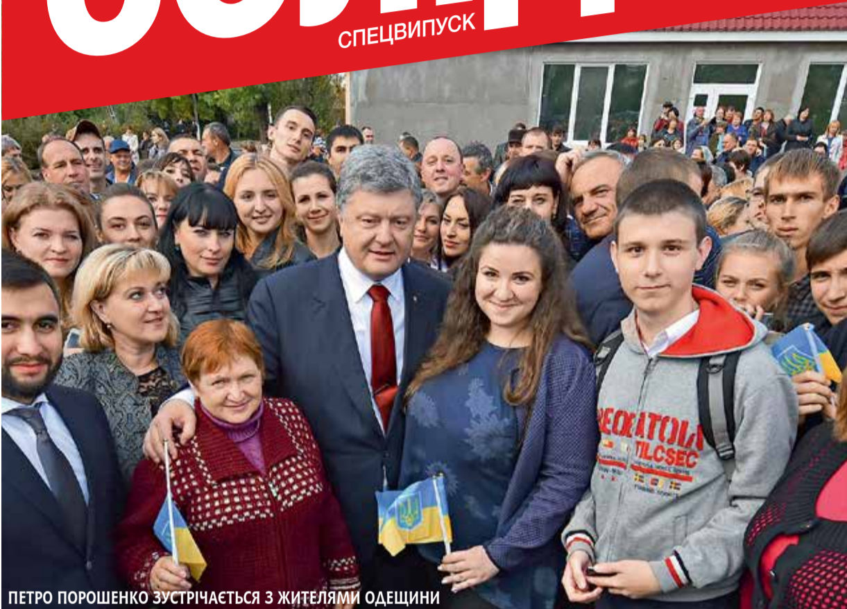
ПЕТРО ПОРОШЕНКО ЗУСТРІЧАЄТЬСЯ З ЖИТЕЛЯМИ ОДЕЩИНИ

Децентралізація стане ще однією нашою цивілізаційною відмінністю від сусідів по радянському табору. Справжнє самоврядування неможливе в авторитарній державі. Деспотія не терпить ані самостійності громад, ані, тим більше, свободи громадянина