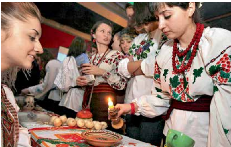
13 грудня – День Святого Андрія Ворожіння під час Андріївських вечорниць – давній слов'янський обряд