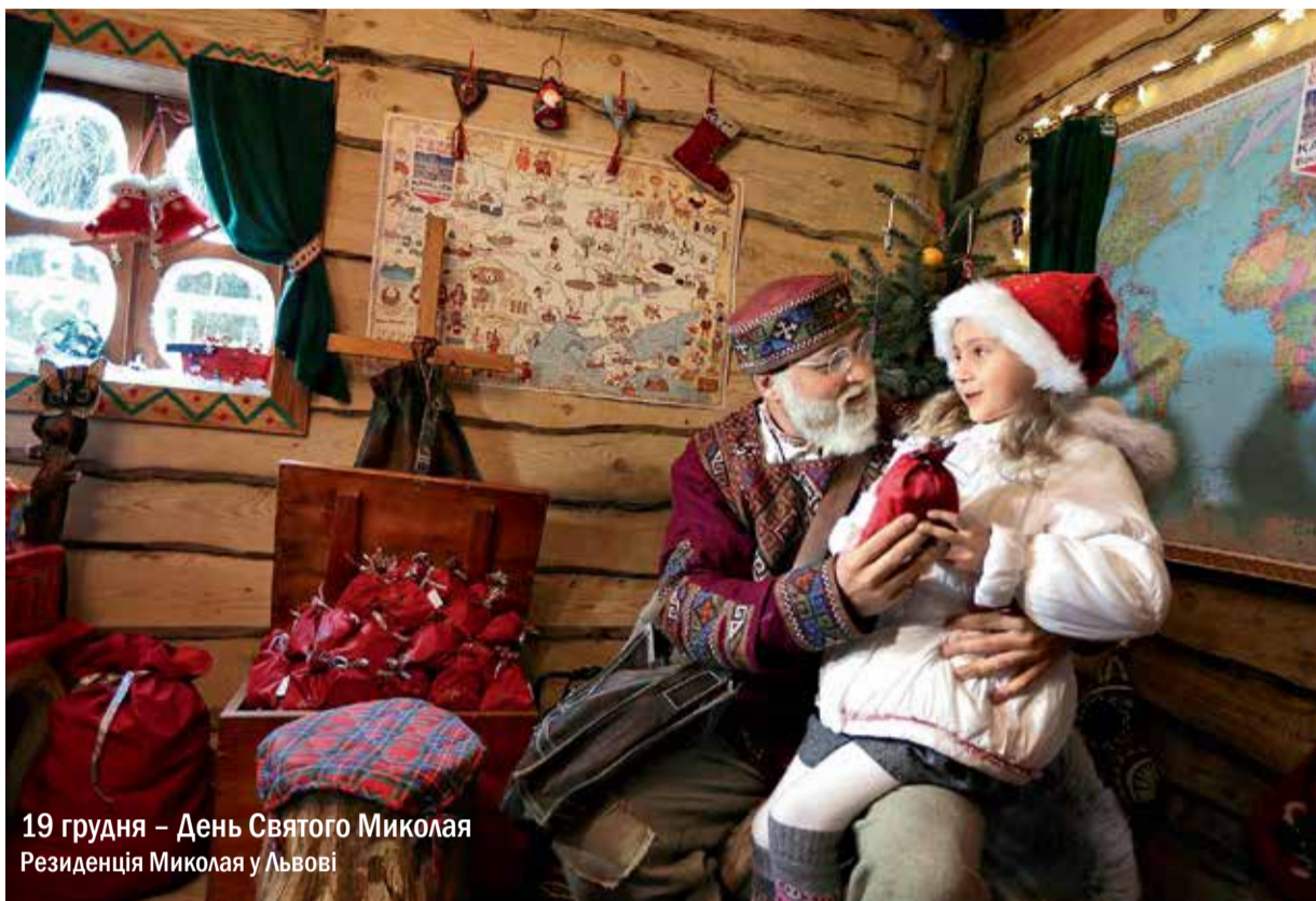
19 грудня – День Святого Миколая Резиденція Миколая у Львові