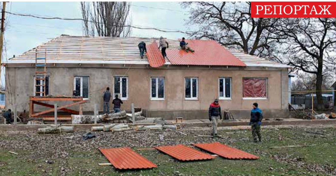
РЕМОНТ АМБУЛАТОРІЇ В КОЧУБЕЇВЦІ